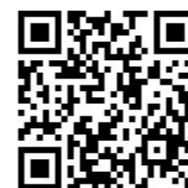
中心學員專用報名連結 (需填寫學員資料完成報名，非學員無法使用)