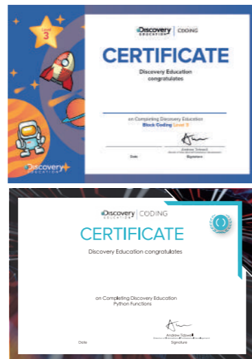
每級課程完成後可參與評估，取得 Discovery Education 認可證書。

上課時間 ■ 每個級別共 18 堂，學費分兩個學段收取 ■ 英語教材 配以廣東話教授